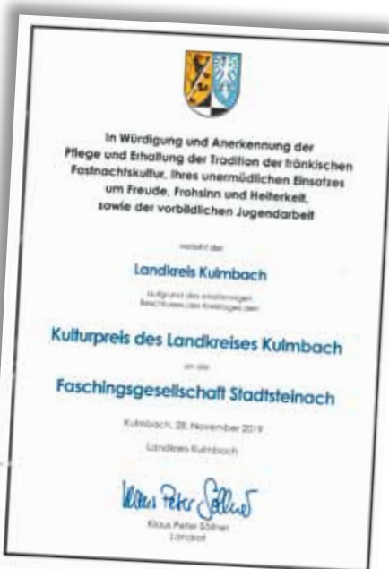
Der Kreistag des Landkreises Kulmbach hat durch einstimmigen Beschluss den Kulturpreis 2019 des Landkreises Kulmbach der Faschingsgesellschaft Stadtsteinach zuerkannt.

Um die prachtvollen Kostüme und das perfekte Make-up kümmern sich engagierte Näh- und Schminkteams. Sie sind ehrenamtlich tätig und sorgen für ein makellostes Outfit.